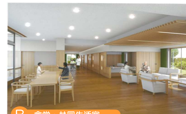
B 食堂・共同生活室

地域の方々やボランティアの方との交流ができる、様々な催しを行うホールです。談話コーナーもあります。