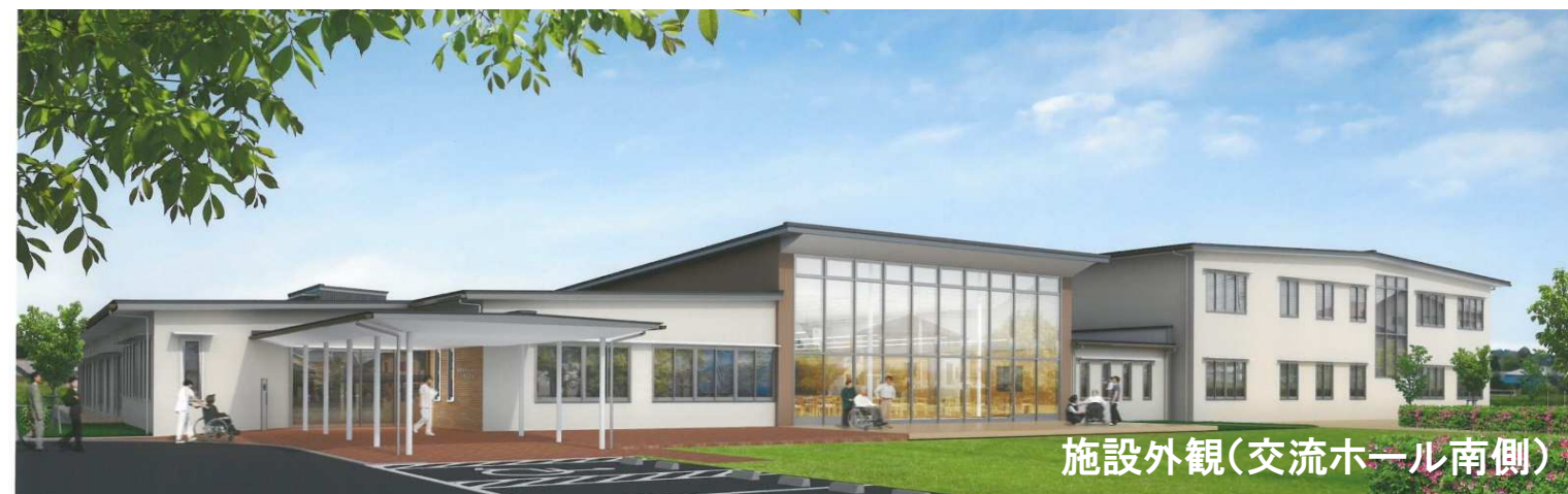
施設外観(交流ホール南側)

経営の持続可能性を図るため人材の育成に努め、職員の自己実現に寄与すると共に、適切な人事労務管理を実現します。